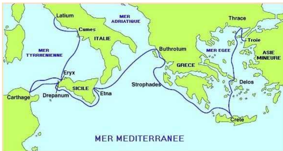
Le périple d'Énée en Méditerranée

L'histoire de Didon est narrée à Énée par Vénus, sa mère, après son accostage non loin de Carthage quand il commence sa reconnaissance du territoire. C'est elle qui lui conseille de se rendre à Carthage pour obtenir la protection de Didon. La reine accueille avec bienveillance Énée et ses compagnons les conviant, le soir venu, à un grand banquet en leur honneur. Après le repas, Didon demande au héros de lui conter ses exploits. C'est ainsi que s'achève le livre I de L'Énéide , les livres II et III sont consacrés au récit des événements depuis la chute de Troie en passant par sa fuite en bateau, ses voyages en Grèce, en Crète et en Sicile.