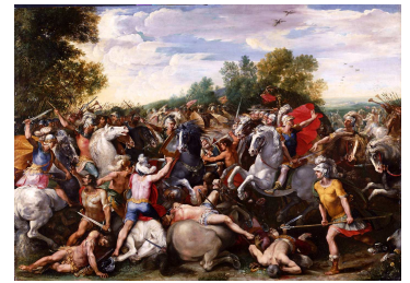
Le Cavalier d'Arpin (1568 – 1640), La Victoire de Tullus Hostilius sur les forces de Veies et de Findena [salle 11]

Vers 1613 Il remporte un prix à l'Académie de Saint-Luc qui lui permet d'obtenir le soutien actif du cardinal Francesco Maria del Monte, mécène de grands artistes tels que Simon Vouet ou Ludovico Cigoli. Le prélat lui ouvre les portes de sa collection où Sacchi découvre notamment les œuvres de Caravage, Carrache, Guido Reni, Guerchin, Titien et Raphaël. Séduit par les idéaux classiques d'Annibal Carrache, il devient l'élève de son principal émule Francesco Albani, dit l'Albane.