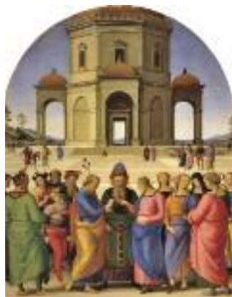
1 Italie, XIV e -XVI e siècle Le Pérugin, Le Mariage de la Vierge

Conception : Service des publics - Fernand Léger, Trois femmes sur fond rouge (détail) , 1927 - Musée d'art moderne et contemporain de Saint-Étienne, © ADAGP, Paris - Traduction : Marion Dilaire - Lesley Coutts - Impression Ville de Caen 15 000 ex. - Juin 2017