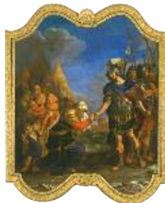
3 Italie, XVII e siècle Le Guerchin, Coriolan apaisé par sa mère