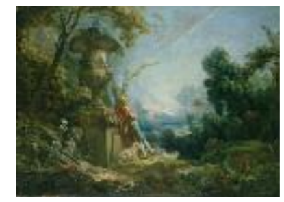
1 Europe, XVIII e siècle François Boucher, Pastorale