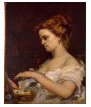
2 France, XIX e siècle Gustave Courbet, La Dame aux bijoux