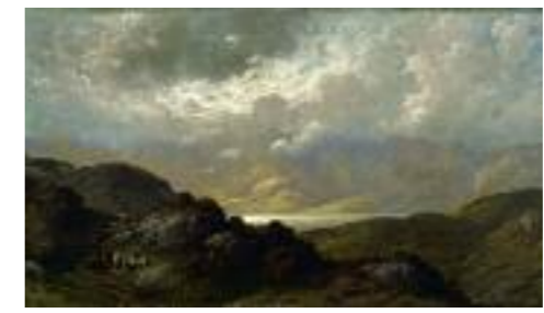
3 France, XIX e siècle Gustave Doré, Paysage d'Écosse