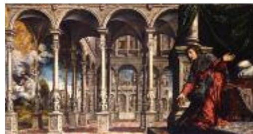
2 Venise, XVI e siècle Paris Bordone, L'Annonciation