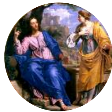
4 France, XVII e siècle Philippe de Champaigne, Le Christ et la Samaritaine