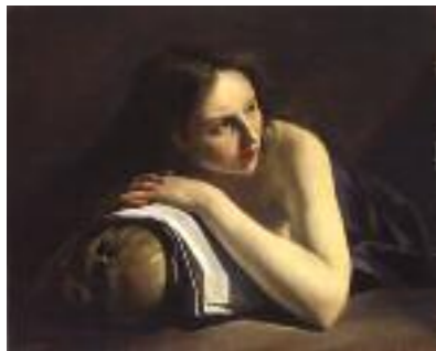
5 Écoles du Nord, XVI e - XVII e siècles Johann Moreelse, Madeleine pénitente