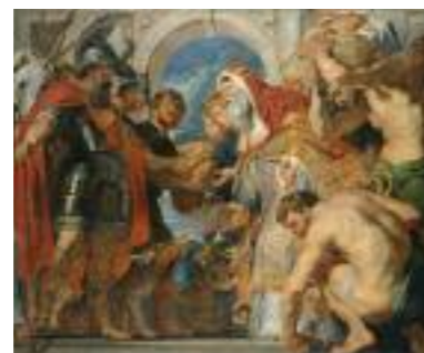
6 Flandres, XVII e siècle Pierre-Paul Rubens, Abraham et Melchisedech