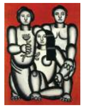
4 Salle cubiste Fernand Léger, Trois femmes sur fond rouge