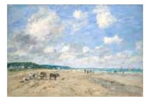
5 France, XIX e siècle Eugène Boudin, La Plage de Deauville