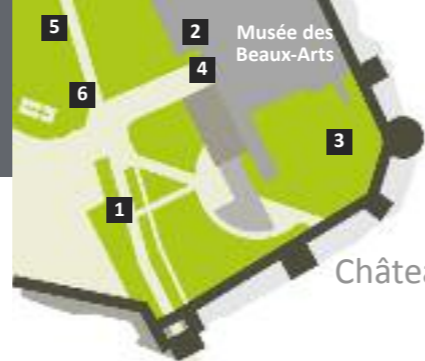
Château de Caen