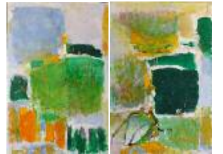
6 XX e siècle Joan Mitchell, The Sky is blue, the Grass is green