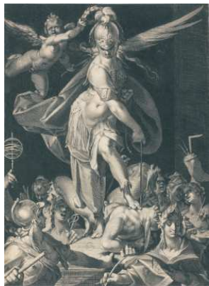
Ægidius II Sadeler, d'après Bartholomeus Spranger, La Sagesse triomphant de l'ignorance , Musée des Beaux-Arts Caen

Quatrième parcours thématique du fonds contemporain du musée en dialogue avec la collection du Fonds régional d'art contemporain Normandie Caen. On y découvre une trentaine d'œuvres s'attachant à la représentation de la lumière sous de multiples formes, dessinées, peintes ou sculptées. Jusqu'à devenir médium (ainsi qu'en témoigne l'installation de Bertrand Lavier ci-contre). Ce nouveau parcours mêle différentes propositions dans une ouverture résolument joyeuse, où la lumière peut être éclat, lueur, reflet, transparence, ou miroitement,... Les artistes contemporains y jouent aussi bien de l'avancée des sciences (l'optique), des usages de l'industrie (la peinture automobile) que des codes de l'esthétique pop (la rutilance colorée).