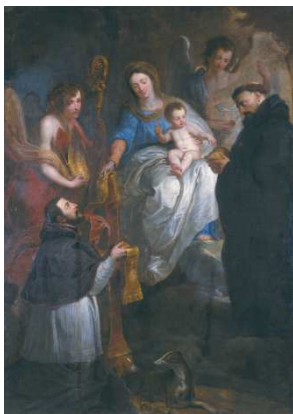
Érasme Quellin, La Vierge donnant une étoile à saint Hubert , 1669, Musée des Beaux-Arts Caen, avant restauration

> Mercredi 14 novembre 2018 à partir de 14 h 30 * < Visite des deux expositions