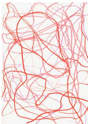
Gilgian Gelzer, Sans titre, 2017