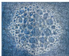
Gunter Damisch, Nachthimmelweltflimmerzentrum, 2013, gravure sur bois © Gunter Damisch

Le musée des Beaux-Arts a choisi d'explorer le monde de l'estampe contemporaine en s'intéressant en particulier aux productions les plus spectaculaires et les plus hétérodoxes. Cinq cents ans après Albrecht Dürer, dont le monumental Arc de triomphe de Maximilien I assemblait pas moins de 36 feuilles imprimées, les artistes plébiscitent plus que jamais le grand format, l'estampe n'étant plus depuis longtemps un instrument de diffusion de l'image mais bien un champ d'expérimentation et un moyen de faire œuvre. Dépasser les règles de l'édition commune conduit à s'emparer de toutes les techniques sans a priori , des plus traditionnelles (gravure sur métal et sur bois, lithographie, sérigraphie...) aux plus novatrices (photogravure, tirage numérique, papier mural...), à jouer avec les limites de l'estampe (gigantisme, support autre que le papier, sérialité, collage...), à interroger enfin les modes de représentation comme les systèmes de fabrication des images.