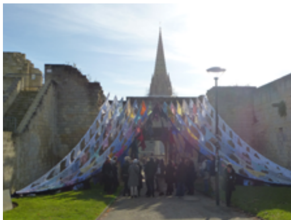
The guarded gate

The guarded gate accueille d'une façon singulière les visiteurs du château à la porte saint-Pierre. Deux ailes protectrices, constituées de 200 chemises usagées offertes par les habitants de la ville, se déploient au dessus de leur tête. La présence des habitants de ces chemises est-elle encore perceptible ?