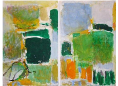
Joan Mitchell, The Sky is Blue, the Grass is Green , Paris, musée national d'art moderne, Centre Georges Pompidou, en dépôt au musée des Beaux-Arts de Caen © Estate of Joan Mitchell

À la différence de Champs , le centre des toiles ne concentre pas l'intensité, toute la surface est mobilisée pour faire ressentir ce paysage élémentaire et si la touche est moins nerveuse que dans Champs , elle reste sensible et contribue au dynamisme de l'ensemble.