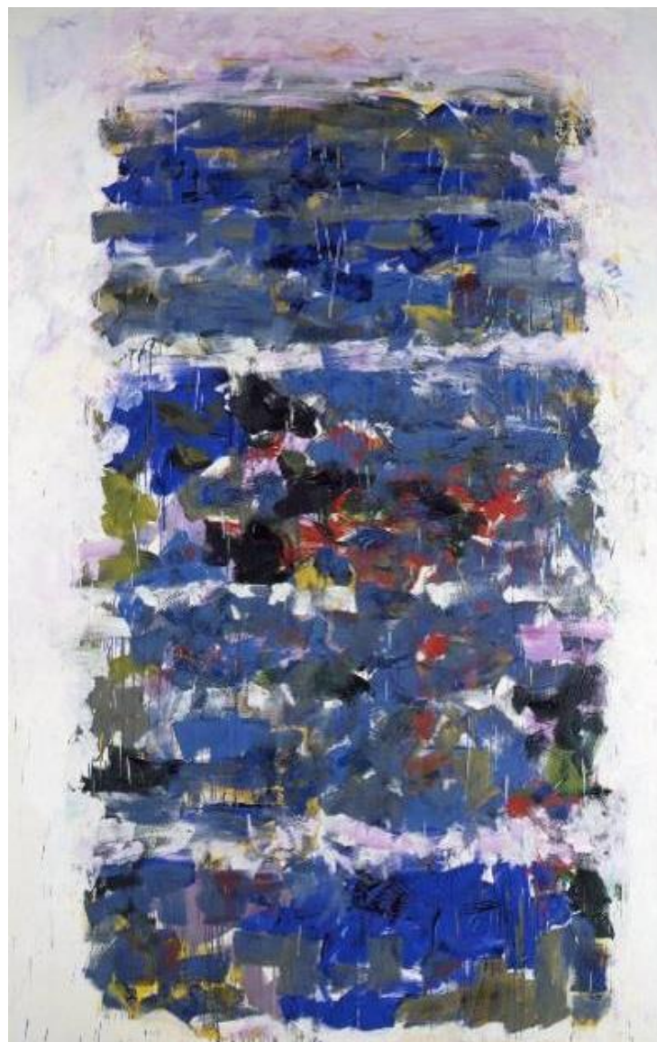
Joan Mitchell, Champs , 1990, Caen, musée des Beaux-Arts © Estate of Joan Mitchell