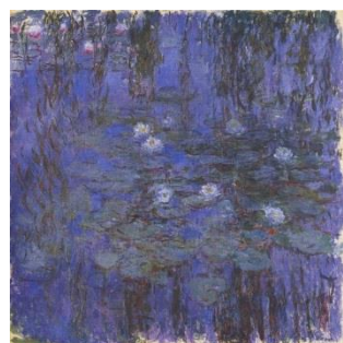
Claude Monet, Les nymphéas bleus , 1916-1919, Paris, musée d'Orsay

Elle s'installe toutefois dans une maison entourée d'un vaste jardin à Vétheuil en 1968, lieu emblématique de l'impressionnisme, à quelques kilomètres de Giverny où Monet a peint ses célèbres Nymphéas . Même si l'artiste les refusait, on peut établir de nombreux parallèles entre la peinture de Joan Mitchell et les œuvres tardives de Claude Monet : l'observation incessante de la nature, l'intérêt pour la couleur et la lumière, le grand format, la frontalité, la touche apparente, l'absence de point de vue, le travail en série et même le fractionnement du tableau car les Nymphéas du musée de l'Orangerie sont aussi composés de plusieurs panneaux. Elaine de Kooning forgea l'expression « impressionnisme abstrait » pour réconcilier deux styles en apparence éloignés.