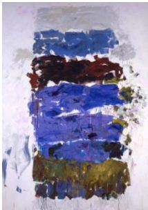
Joan Mitchell, Champs , 1990, Fonds national d'art contemporain, en dépôt au musée des Beaux-Arts de Caen © Estate of Joan Mitchell