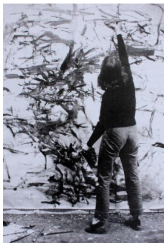
Joan Mitchell, New-York, 1957

En 1952, survient un tournant décisif dans la peinture de Mitchell, qui passe de la forme peinte au geste autonome du pinceau. Le coup de pinceau devient donc l'empreinte d'un geste, rejoignant ainsi le courant expressionniste abstrait inauguré par Jackson Pollock. Grande sportive dans sa jeunesse, Joan Mitchell avait appris à connaître son corps et à se mettre en condition, par concentration, pour donner le meilleur d'elle-même. Dans la peinture gestuelle de Joan Mitchell, tout le corps s'engage dans une réelle dépense physique. La force et l'énergie qui se dégagent de chaque peinture permet au visiteur d'être « dans la peinture » et de partager l'émotion reçue devant un champ, un arbre ou un paysage pris dans une certaine lumière, émotion qui manifestement était essentielle à Joan Mitchell pour peindre et sans doute aussi pour vivre. Le tableau est bien l'arène des gestes, la scène de la mémoire où tout revient. Joan Mitchell a conservé de l' Action Painting le travail « all-over » sur de grands formats. Mais Champs garde une bordure blanche tout autour de la toile, restant ainsi une fenêtre ouverte sur le monde.