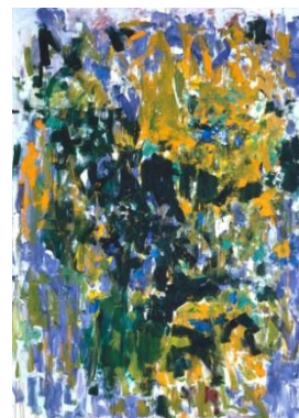
Joan Mitchell, Tournesols, 1976, Houston, musée des Beaux-Arts, legs Caroline Wiess Law

Après son installation en France en 1959, elle s'intéresse aux réflexions sur la couleur menées par Claude Monet et Vincent Van Gogh envers qui elle nourrit une admiration sans borne. Elle préfère d'ailleurs se réclamer du Hollandais d'Auvers-sur-Oise plutôt que de Claude Monet, à la proximité visiblement envahissante. Elle se reconnaît notamment dans le désir de Van Gogh d'exprimer l'émotion par la couleur et c'est à lui qu'elle dédie une série de toiles inspirées par les Tournesols .