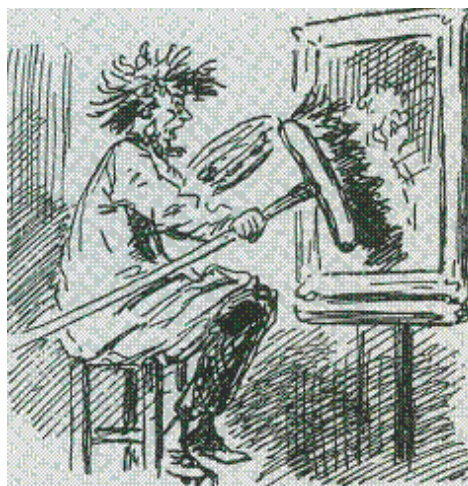
NOUVELLE ÉCOLE. — PEINTURE INDÉPENDANTE Indépendants de leur volonté. Espérons-le POUR EUX.