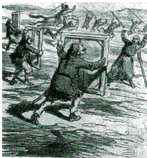
BIEN FÉROCE! Les Yverca récoltant plusieurs toiles à l'Exposition des Impressionnistes. Pour être servis en cas de gâches.