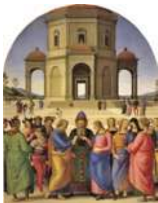
Pietro Vannucci dit Le Pérugin, Le Mariage de la Vierge, 1504, huile sur bois, Caen, musée des Beaux-Arts