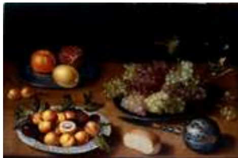
Osias Beert (atelier de), Nature morte aux raisins, grenades et abricots, vers 1600-1610, huile sur bois, Caen, musée des Beaux-Arts