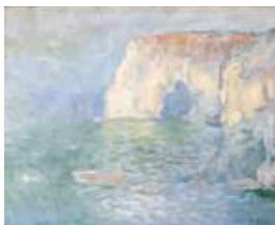
Claude Monet, Étretat. La Manneporte, reflet sur l'eau , 1885, huile sur toile, dépôt du musée d'Orsay