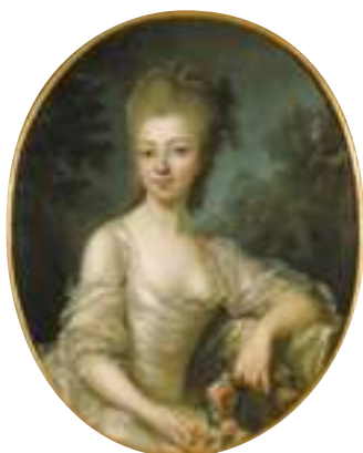
Louise-Elisabeth Vigée-Lebrun, Portrait de jeune femme inconnue , 1775, huile sur toile, Caen, musée des Beaux-Arts