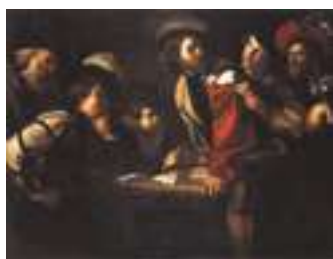
Bartolomeo Manfredi (d'après), Soldats jouant aux cartes , huile sur toile, envoi de l'État, 1811