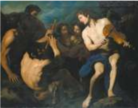
Pietro Giovanni Novelli, Duel musical d'Apollon et de Marsyas, 1631-1632, huile sur toile, Caen, musée des Beaux-Arts