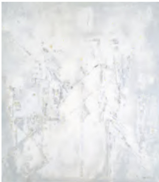
Maria Helena Vieira da Silva, Arcane, 1970-1978, huile sur toile