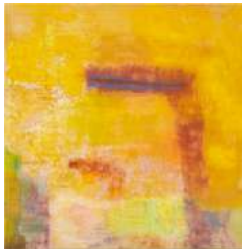
Monique Frydman, Jaune Absinthe I , 1989, pigments pastels et liant sur toile de coton 189x197cm @AnaDrittanti

DE LA GRANDE SECTION AU CM2 Durée : 2 h | Tarif : 40€, sur réservation