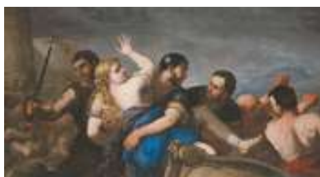
Luca Giordano, Enlèvement d'Hélène , vers 1686, huile sur toile, Caen, musée des Beaux-Arts.