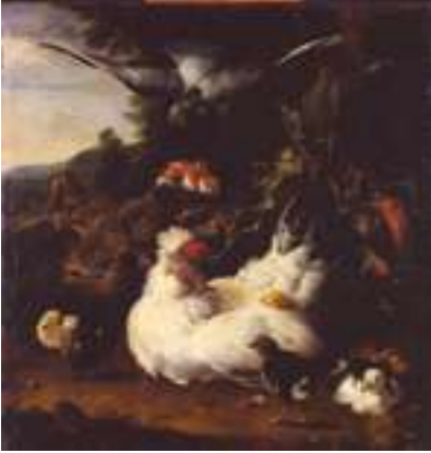
Melchior de Hondecoeter, Une poule et ses poussins, vers 1678-1680, huile sur toile, Caen, musée des Beaux-Arts.