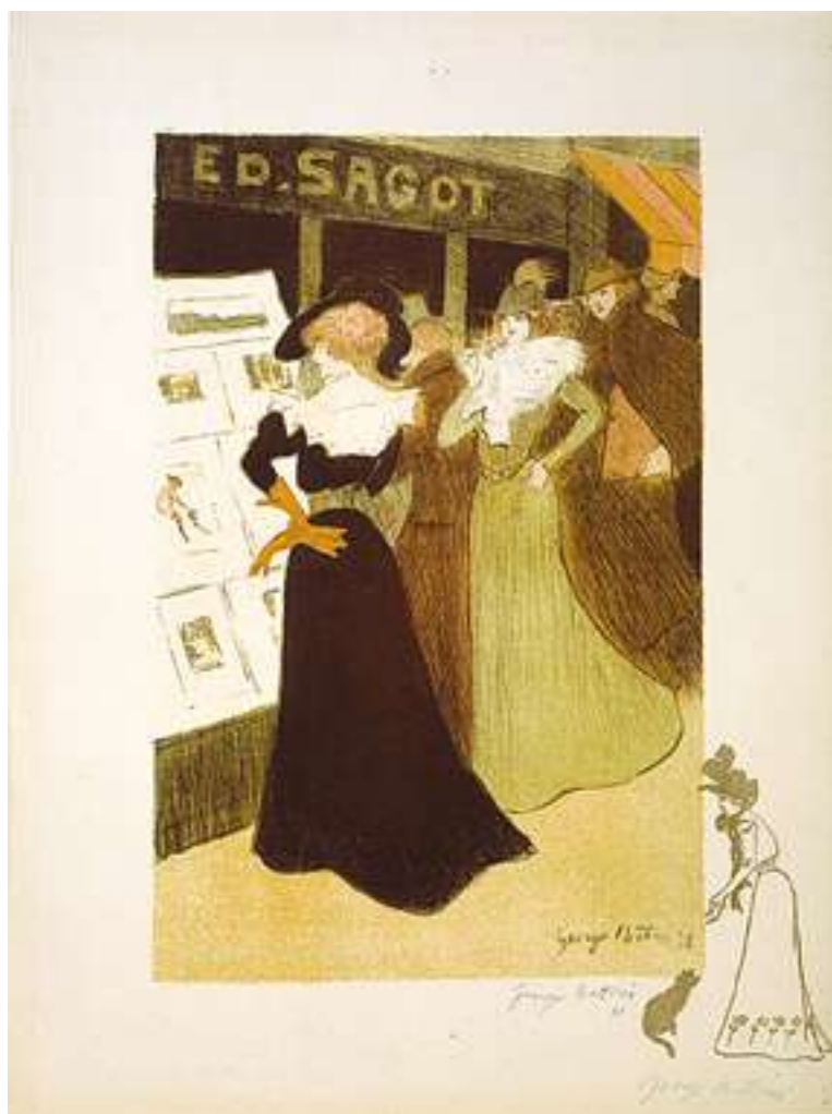
Georges Bottini, Les élégantes devant la boutique Ed. Sagot , 1898, lithographie, Genève petit palais