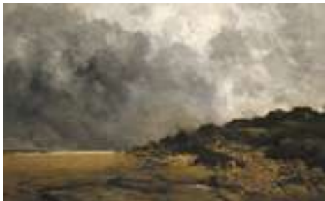
Antoine Guillemet, La Plage de Villerville , 1876, huile sur toile, Caen, musée des Beaux-Arts.