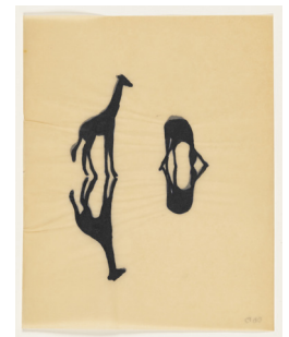
Études, 1996, encre, papier oignon plié, 26 x 22 cm

Pour toutes les oeuvres : Courtesy de l'artiste, de la galerie Jean Fournier, de la galerie Réjane Louin Crédits photographiques : Copyright Dominique De Beir-ADAGP | Nicolas Pfeiffer